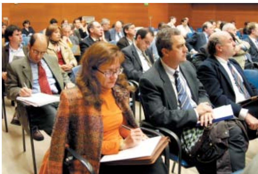
► Asistentes a la Jornada.