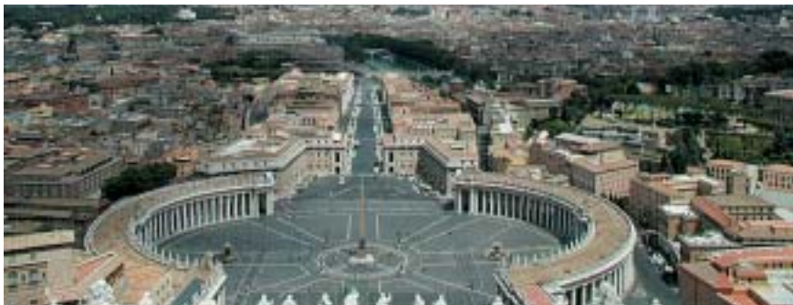
Roma fue el escenario del pasado Consejo Federal del MEI

Abrió la reunión Rocco Buttiglione , el Ministro de Asuntos Europeos italiano quién defendió la necesidad de la Constitución europea, cuya aprobación en el Consejo de Roma que se celebraría la semana siguiente consideraba difícil.