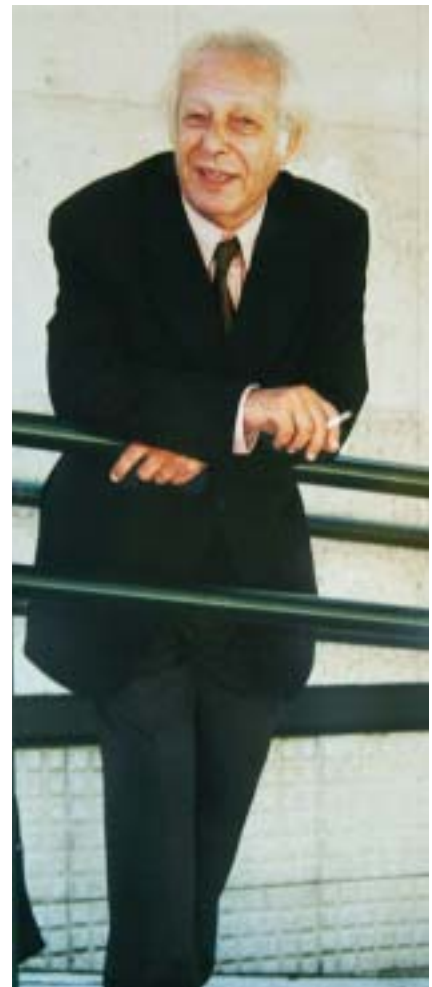
Samir Amin, durante su reciente visita a Euskadi.

No, porque las fuerzas sociales y políticas sobre las que se apoya el proyecto no lo son. Tanto si recurre a la dirección de la iglesia chií, que pretende la instalación de un régimen islámico, o si acude a los restos del aparato de Sadam. Además, Ahmed Chalabi, su principal candidato, carece de personalidad.