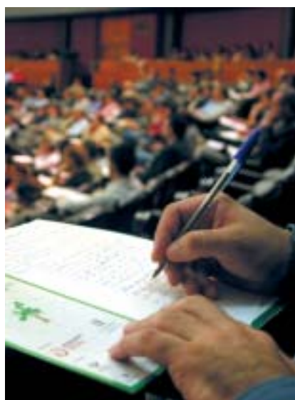
► Detalle del público asistente