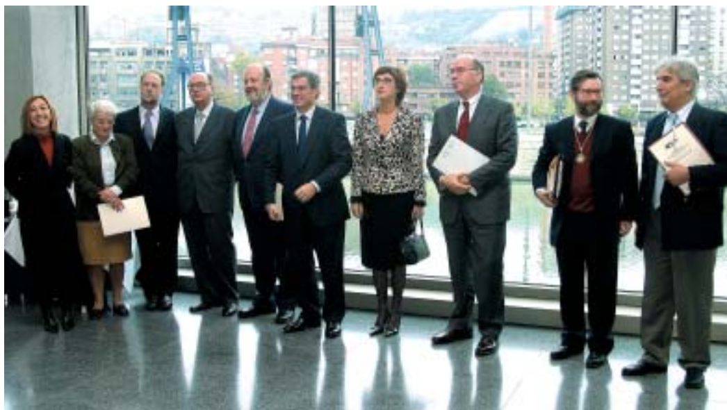
► Organizadores y colaboradores en la apertura de la jornada.

Colaboradores: Secretaría General de Acción Exterior, Diputación Foral de Bizkaia, Real Sociedad Bascongada de Amigos del País, Dpto. de Relaciones Internacionales. UPV/EHU.