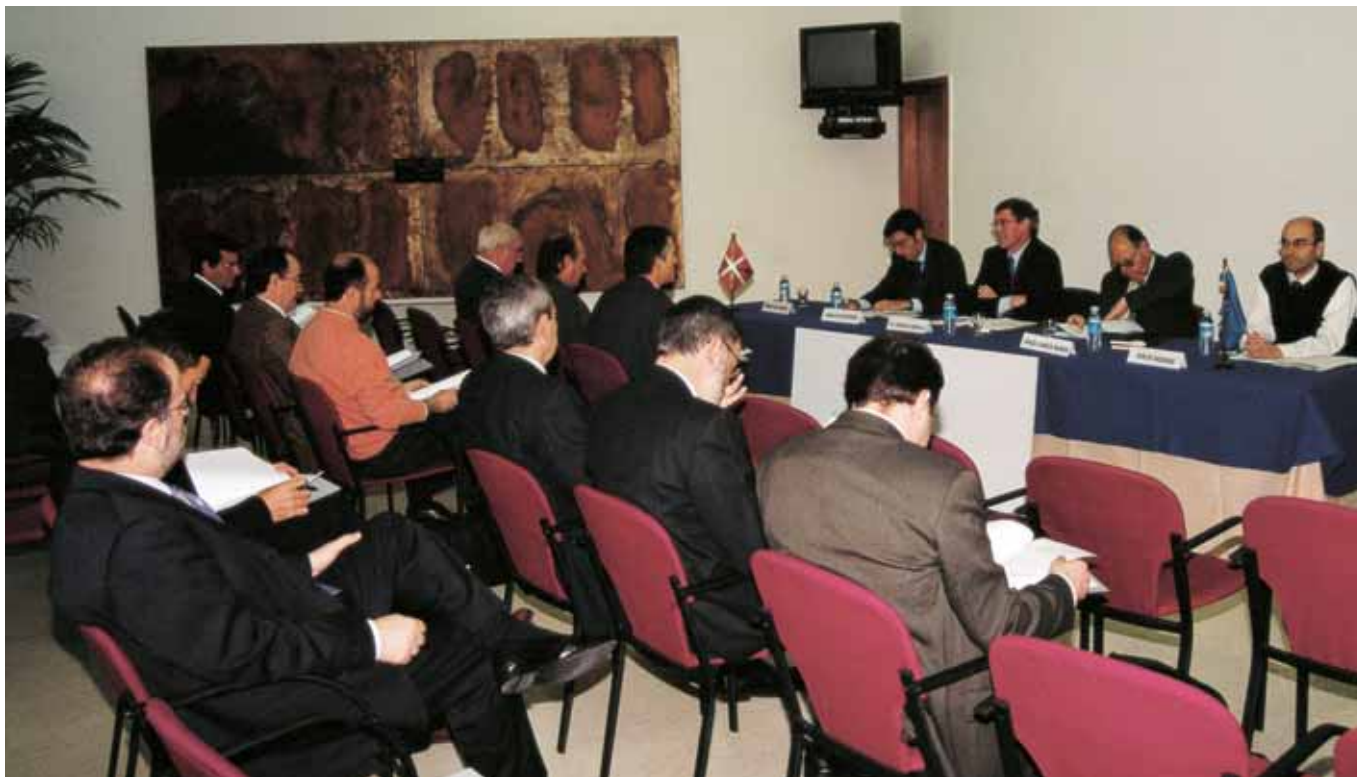
El EMEK/CVME celebró en mayo su VI Asamblea General.

El Consejo Vasco del Movimiento Europeo celebró el pasado día 9 de mayo su VI Asamblea General, en la que se aprobaron los presupuestos del año 2002 y la liquidación del año 2001, cuestiones que habían quedado pendientes en la V Asamblea General, celebrada el 17 de diciembre de 2001.