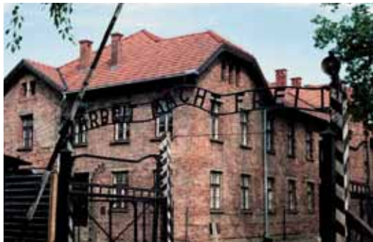
Puerta principal del Campo de Concentración de Aushwitz.

"...Ollegar de una vez a la desdeñable condición de otros países industriales, donde la carencia de objetivo post-material y el hiperconsumo opacan los logros del progreso económico, hasta refundir el sentido vital de la existencia, llevándolos a una sociedad del rendimiento, donde