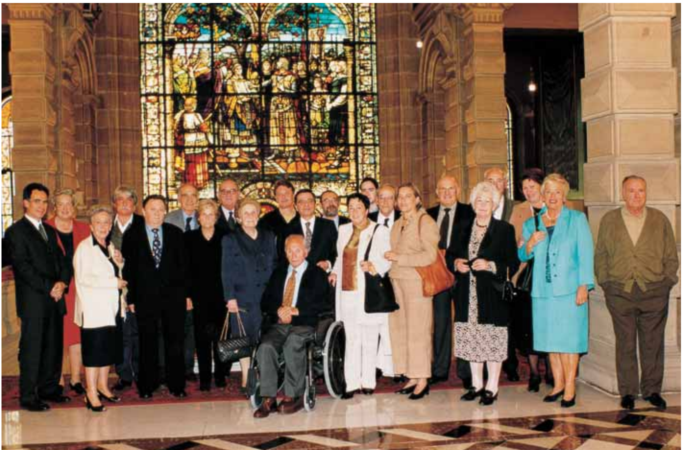
Los participantes en el "Contubernio de Munich" y sus familiares en el homenaje que el EMEK/CVME les rindió en la Diputación Foral de Gipuzkoa.