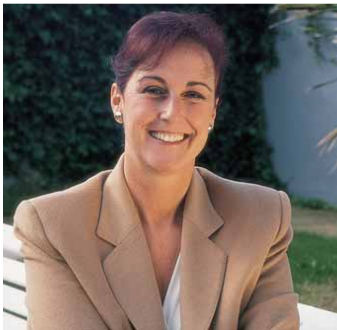
Txaro Arteaga, directora de Emakunde.

Según explica la directora del Instituto Vasco de la Mujer, desde 1982 se han desarrollado cinco programas de Acción comunitaria para la igualdad de oportunidades, adaptados en los distintos países miembros a sus características y necesidades. En el marco de estos programas, aprobados por la Comisión Europea, se han desarrollado