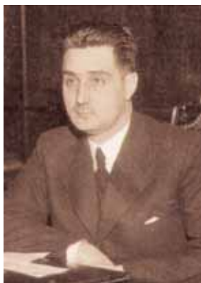
Jesús María Leizaola.

Leizaola (1896-1989) ha sido uno de los políticos vascos con más amplia trayectoria a lo largo del siglo XX: abogado; militante de Comunión Nacionalista Vasca (desde 1919); afiliado a Solidaridad de Empleados Vascos, una de las secciones de la central ELA; diputado por el PNV durante la II República española (1931 y 1933); alto funcionario en la administración pública (en 1934 fue nombrado secretario de la Diputación de Gipuzkoa); consejero de Justicia y Cultura en el primer Gobierno Vasco (1936) -uno de sus decretos fue la creación de la Universidad Vasca-; y consejero de Hacienda y Justicia (desde 1946). Tras la muerte de José Antonio Aguirre, ocupó la más alta responsabilidad institucional: lehendakari del Gobierno Vasco desde 1960 a 1979, año en el que regresó del exilio. Incluso en 1980 fue