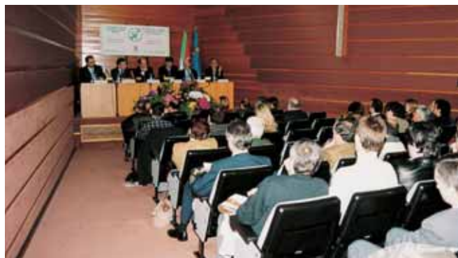
Numeroso público asistió a la entrega del I Premio Francisco Javier de Landaburu.