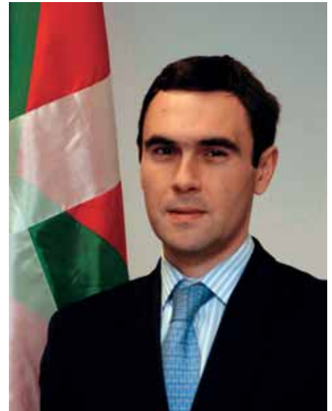
Iñaki Rica, director de Asuntos Europeos del Gobierno Vasco.

sobre la valoración del Protocolo sobre los principios de Subsidiariedad y Proporcionalidad. Este Protocolo, aprobado en el Tratado de Amsterdam, establece unas recomendaciones para la correcta aplicación de dichos principios por parte de las instituciones europeas. La valoración analizará principalmente sus efectos y carencias, así como la interpretación que realizan las instituciones de la Unión. La tercera parte hará referencia a la necesidad de que se creen mecanismos