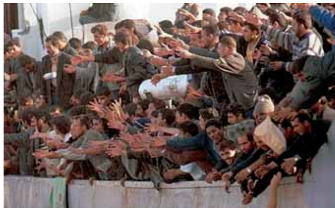
Decenas de inmigrantes extienden las manos solicitando comida.

no faltan la xenofobia y el rechazo a los aventajados mandrines "sudacas", esa minoría de inmigrantes que accede a la península para saquear joyas y monedas de bolsillos y armarios, objetos preciosos esos, acaso resultado de la fundición cientos de veces repetida de los metales que otra minoría dentro de los inmigrantes, mandrines del siglo XVI, llevaron de América para componer sus maltrechas economías familiares".