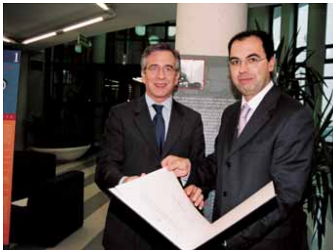
El director general para la Ampliación de la Comisión Europea, Eneko Landaburu, entregó el premio al catedrático José Martín y Pérez de Nanclares.

Seguidamente, José María Gil-Robles reflexionó sobre el posible modelo futuro de la Unión Europea y se mostró a favor de una Europa cuyo modelo federal siga los principios del alemán que, “aunque no se quiera decir, es el que tenemos, y es el que ha ido funcionando porque es el que mejor se adapta a nuestras necesidades”. O, lo que es lo mismo, una Europa con un “poderoso elemento de representación de los Estados, con funciones legislativas y ejecutivas, ya que no hay que olvidar que hay que conjugar entidades con tradiciones milenarias”, con un ejecutivo elegido por el Parlamento Europeo, institución que ha ido adquiriendo un mayor peso.