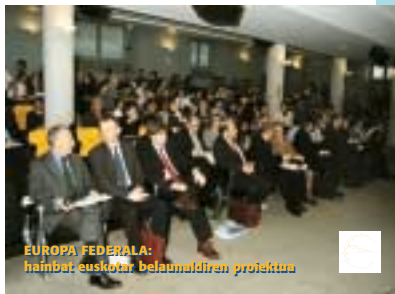
EUROPA FEDERALA: hainbat euskaratan beharrezko proiektua