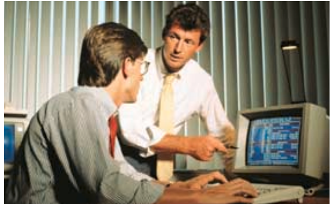
Incrementar las inversiones en investigación y desarrollo es uno de los objetivos que se ha propuesto Euskadi.