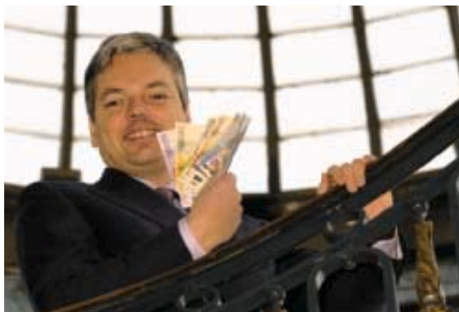
Didier Reynders, presidente del Ecofin durante el semestre de Presidencia belga de la UE, con unos billetes de euro durante la Cumbre de Laeken.

El 15 de diciembre de 2001 pasará a la historia de la Unión Europea. Fue ese día cuando los Quince, reunidos en el Consejo Europeo en la ciudad belga de Laeken, abrieron un nuevo proceso de reforma, el cuarto en una década, que deberá dar como fruto la Constitución europea. Sin embargo, ésta no será una reforma como las anteriores. La Declaración firmada por los Estados miembros en Laeken da el banderazo de salida para la transformación más importante del proceso de construcción europea iniciado en 1950 con la Declaración Schuman.