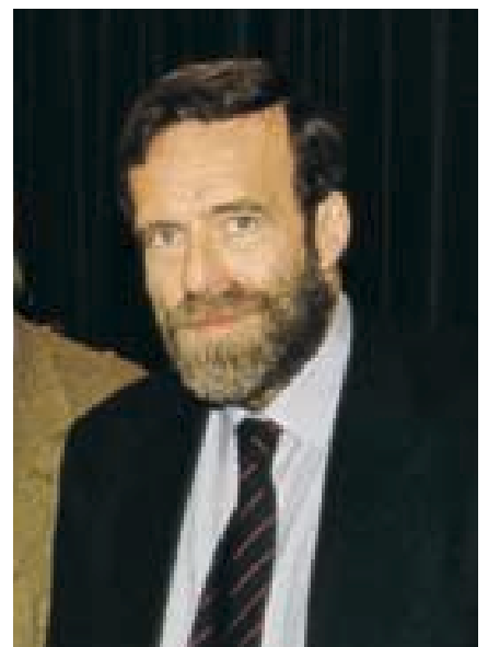
El presidente del Centre for Economic Policy Research de Londres Guillermo de la Dehesa.

Respecto a los movimientos antiglobalización, señaló que hay que tener en cuenta que empiezan a tener más reputación e importancia que los partidos políticos, por lo que auguró una situación complicada para éstos de cara a un futuro. Esto se debe, en su opinión, a que la sociedad se está posicionando en favor de una democracia más participativa que representativa, en gran parte debido al uso de Internet. Otro hecho que De la Dehesa cree necesario analizar es que "si bien a los jóvenes les gusta por lo general ir a protestar, los que lo hacen son los jóvenes de los países ricos con dinero suficiente para asistir a las "cumbres" en diferentes partes del planeta".