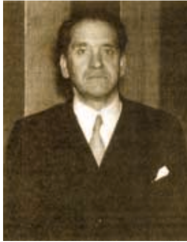
Manuel de Irujo

Manuel de Irujo (Lizarrar-Estella, 1891/Iruñea-Pamplona, 1981) es una de las figuras más relevantes de la historia contemporánea vasca, en la que se muestran sus facetas de protagonista político (nacionalista vasco, parlamentario, dirigente de instituciones vascas, ministro de gabinetes republicanos españoles, impulsor de entidades europeístas); jurista (ejerció la abogacía); e intelectual (conferenciante, articulista...).