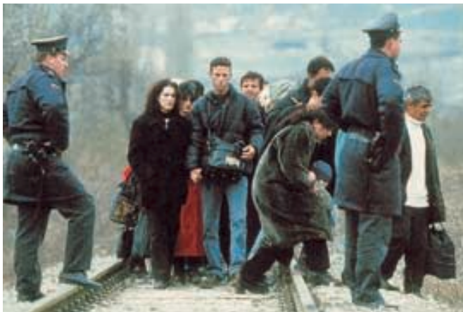
La inmigración es uno de los grandes temas de debate en la Europa del siglo XXI, por lo que el EMEK/CVME celebrará un seminario monográfico sobre esta materia.

Europako Mugimenduaren Euskal Kontseiluaren 2002ko jardura programan, azkenik, honako hauek jasotzen dira: lehen hiruhilekoan EMEKaren VI. biltzar nagusia egitea eta Eurobask aldizkariaren bi zenbaki argitaratzea. Aldizkari horietan, aipatuko dira, besteak beste udaberriaren egingo den gobernu arteko konferentzia eta Europar Batasunean sartzeko prozesuari dagokionez herrialde berriekin egin dituzten urratsak.