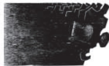
Portada del libro Las Redes Transeuropeas y el modelo federal de la UE. Una visión desde Euskadi.

LAS REDES TRANSEUROPEAS (RTE) Y EL MODELO FEDERAL DE LA UE Una visión desde Euskadi