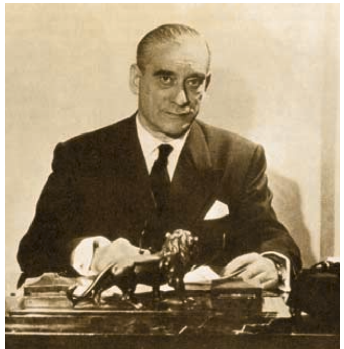
Francisco Javier de Landaburu

Parte de sus textos políticos y doctrinales, contribuciones periodísticas, informes reservados, etc., están recopilados en sus Obras Completas , que fueron publicadas entre 1980 y 1983 en 4 tomos. Destaca su libro La causa del pueblo vasco (1956), en cuyo capítulo "De la nación vasca a Europa y al mundo" presentaba su pensamiento europeísta. Se declaraba "federalista militante" y abogaba por la "Europa de los pueblos" en la que tendría un "puesto" el vasco.